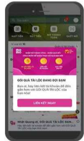
3/ Chọn "Liên kết ngay"