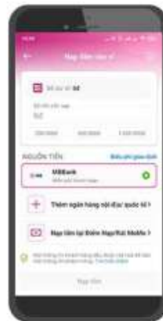
5/ Nạp tiền vào Ví chỉ từ 10.000đ.