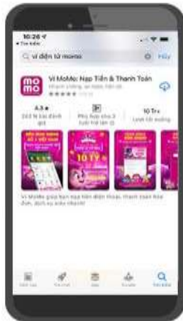
1/ Tải và đăng ký tài khoản Ví MoMo