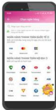
4/ Liên kết tài khoản ngân hàng